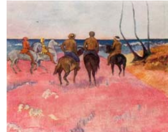
Paul Gouguin, Cavalieri sulla spiaggia , 1902 olio su tela Essen, Folkwang Museum