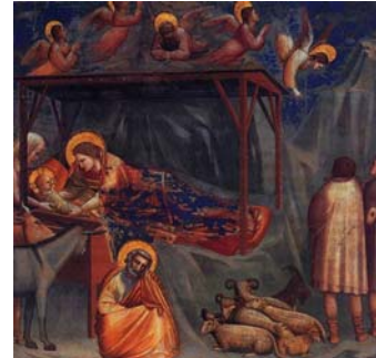
Giotto, Natività , 1303-1305 Affresco. Padova, Cappella degli Scrovegni