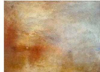
J. Turner, Tramonto sul lago , 1840 ca, Olio su Tela, Londra, Tate