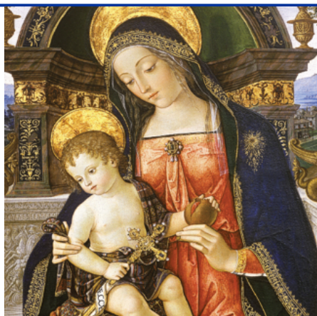
Pintoricchio, Pala di Santa Maria dei Fossi , 1495, Galleria Nazionale Perugia (particolare)

La Provincia di Rimini, in collegamento con i comuni che fanno parte del territorio, ha ideato e creato un progetto di informatizzazione delle biblioteche comunali. L'obiettivo che la provincia voleva raggiungere era quello di garantire a ogni cittadino il diritto di poter usufruire dei