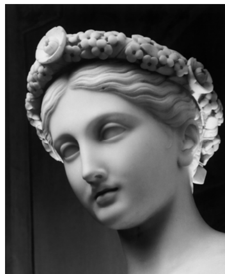
"CANOVA alla corte degli Zar" Capolavori dall'Ermitage di San Pietroburgo Prorogata fino al 24 agosto 2008 Milano

I sistemi di gestione e di sviluppo e oggi eONE risulta un sistema completo