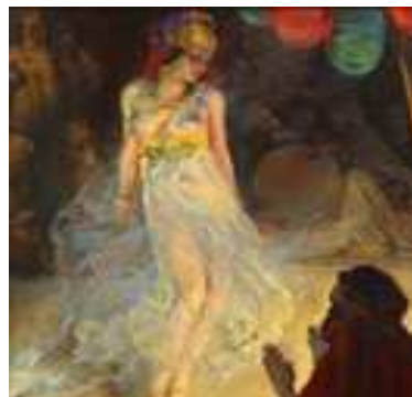
Jules Pierre Van Biesbroeck, Danse sous la tente au désert, 1900 ca., Musée d'Art moderne et d'Art contemporain de Liege