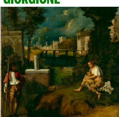
LA TEMPESTA (1504 circa) Galleria dell'Accademia - Venezia - XVI secolo Tela cm. 82 x 73