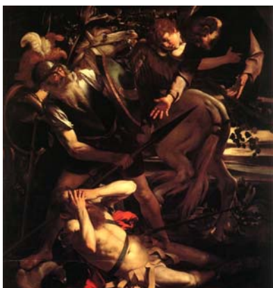
CONVERSIONE DI SAULO. Roma, collezione privata