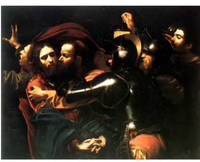
Cattura di Cristo nell'orto. Dublin, National Ireland Gallery